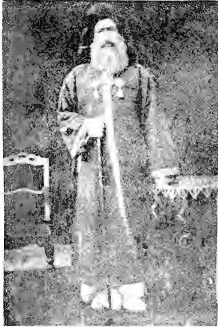
المولى مطاب بن نصر الله المشعشي